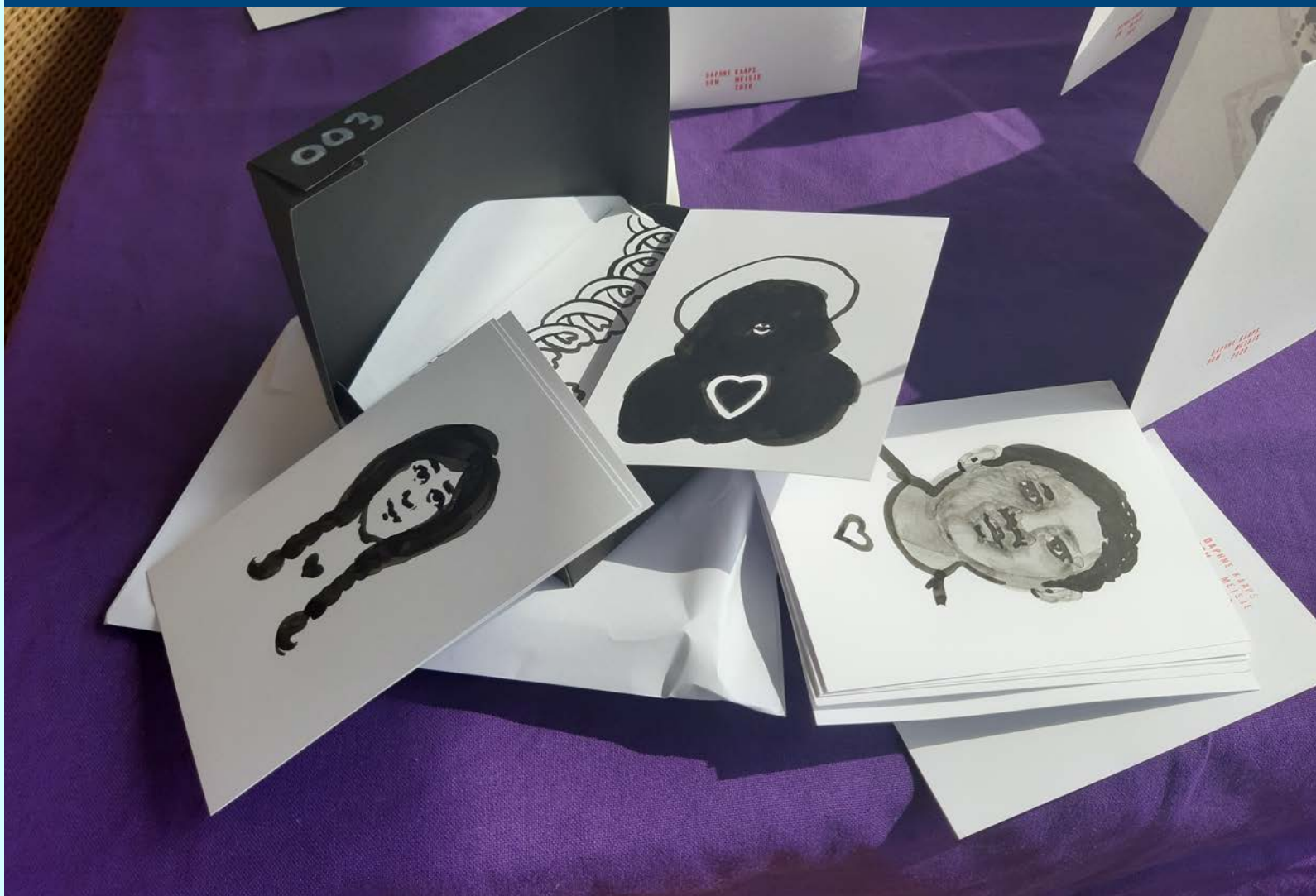
Kaarten van Daphne Bom